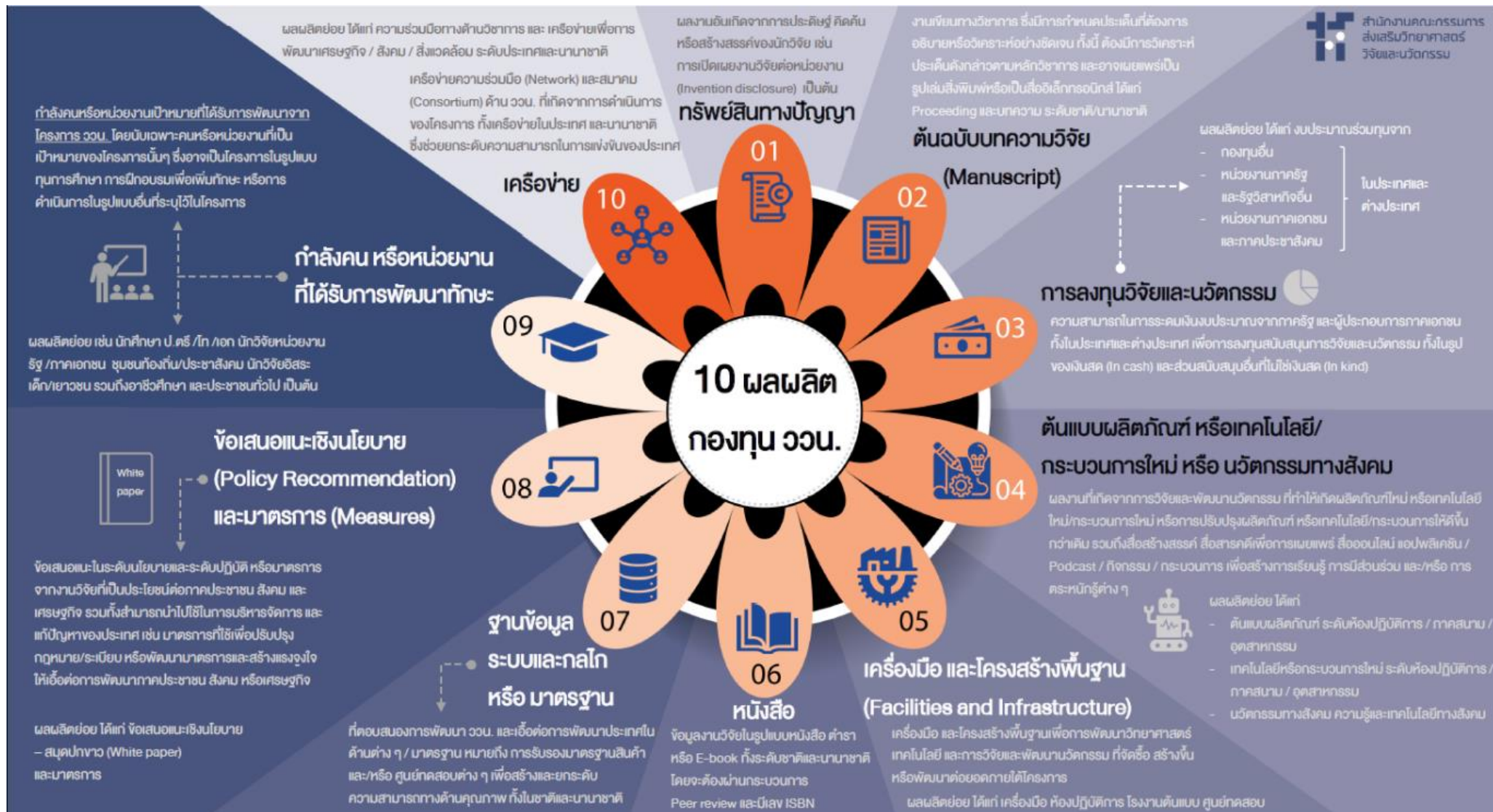
รูปที่ 2 ประเภทและนิยามผลผลิต